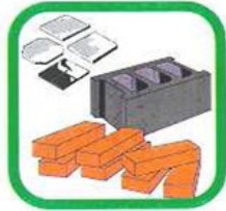
BETONS BRIQUES TUILES