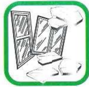
VERRES VITRES (sans cadres)